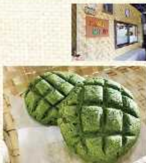
▲まっちゃメロンパン 250円(税込)