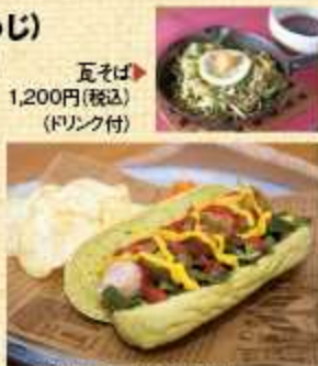
▲和東ドッグ 500円(税込)