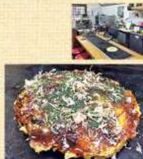
▲ミックスかすモダン 800円(税込)