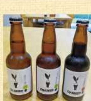
▲茶ビール(左からかぶせ茶、煎茶、ほうじ茶) 600円(税込) (1本あたり)