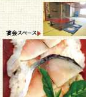
▲茶葉寿司(さばずし) 500円(税込)