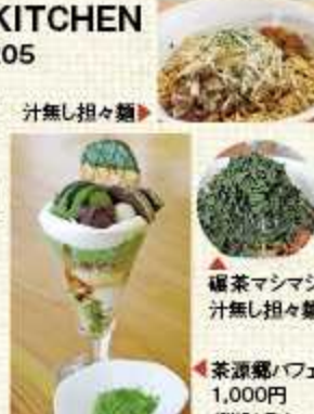
▲碾茶マシマシ汁無し担々麺 1,000円(税込)予定