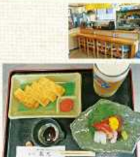
▲造り盛合せ 900円(税込)~ (仕入れにより内容は異なります)