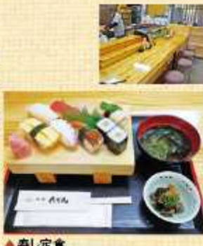
▲寿し定食 (写真の小鉢は煎茶で飲いたマグロの角煮) (丹~全)1,200円(土、日)1,500円(税込)