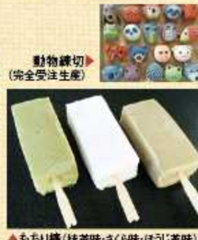
▲もちり棒(抹茶味・さくら味・ほうじ茶味) 1本 150円(税込)