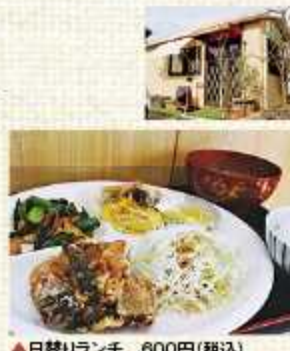
▲日替りランチ 600円(税込)