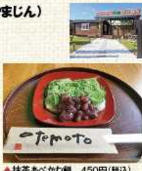
▲抹茶あべかわ餅 450円(税込)