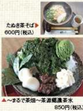
▲たまご茶そば 600円(税込) ▲〜まるで茶畑〜茶源郷濃茶水 850円(税込)