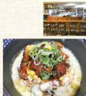
▲チーズダッカルビチャーハン 850円(税込)