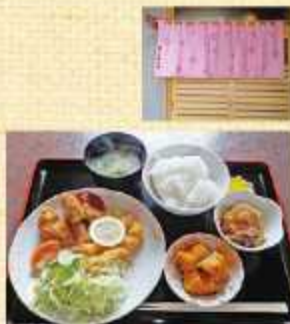
▲日替定食(限定20食) 750円(税込) (写真例ミックスフライ)