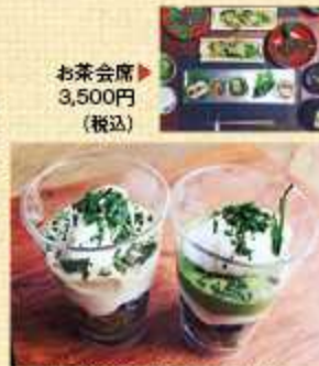
▲和東産抹茶濃厚テリーヌプリン (写真左はほうじ茶味) 500円(税込)